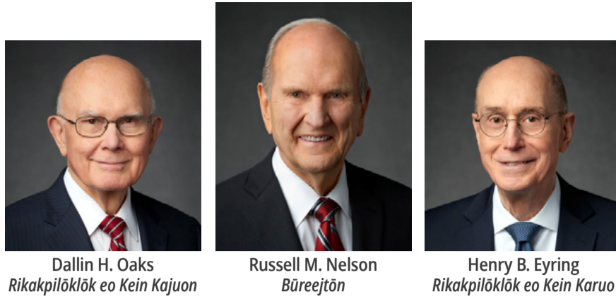
Dallin H. Oaks Rikakpilöklök eo Kein Kajuon Russell M. Nelson Büreejtön Henry B. Eyring Rikakpilöklök eo Kein Karuo