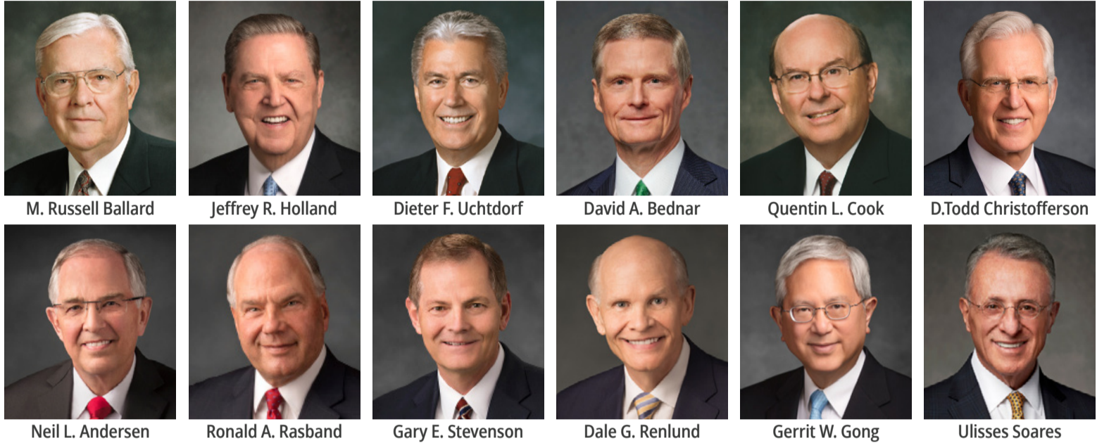
M. Russell Ballard Jeffrey R. Holland Dieter F. Uchtdorf David A. Bednar Quentin L. Cook D. Todd Christofferson Neil L. Andersen Ronald A. Rasband Gary E. Stevenson Dale G. Renlund Gerrit W. Gong Ulisses Soares