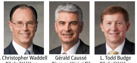
W. Christopher Waddell Rikakpilöklök eo Kein Kajuon Gérald Caussé Bisop eo Utiej ej Töl L. Todd Budge Rikakpilöklök eo Kein Karuo