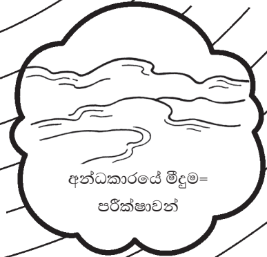
අන්ධකාරයේ මීදුම = පරීක්ෂාවන්