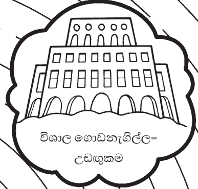
විශාල ගොඩනැගිල්ල = උඩඟුකම