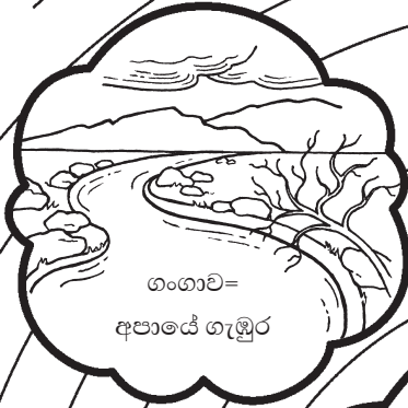
ගංගාව = අපායේ ගැඹුර

ලෙහිගේ දර්ශනයේ ජීවන වෘක්ෂයට ළඟා වීම වළක්වන දේවල් මගහරිමින්, ලෙහිගේ දර්ශනයේ පැටලීලි සහිත මාර්ගය හරහා ඔබේ මාර්ගය සොයා ගන්න.