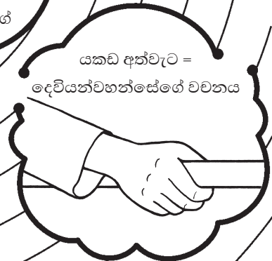
යකඩ අත්වැට = දෙවියන්වහන්සේගේ වචනය