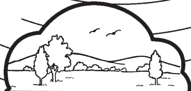
භූමිය = පොළොව