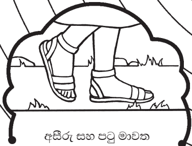
අසිරු සහ පටු මාවත