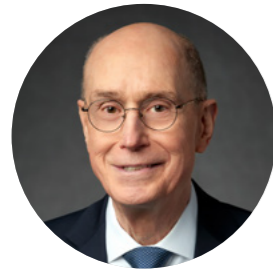
Por el presidente Henry B. Eyring, Segundo Consejero de la Primera Presidencia