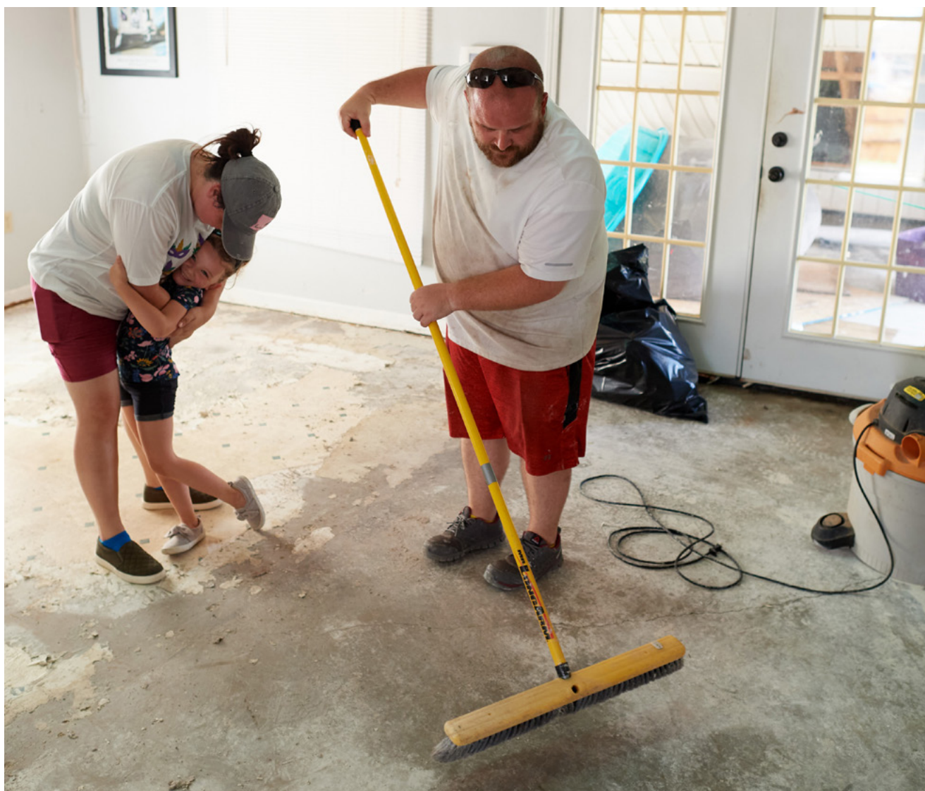
Ci-dessus : après l'ouragan Ida, des bénévoles de la collectivité, notamment des membres de l'Église de Jésus-Christ des Saints des Derniers Jours, ont passé leur week-end de la Fête du Travail à nettoyer.