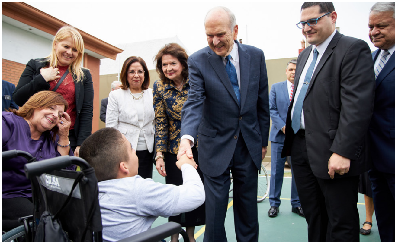
Ci-dessus : en 2019, au cours de son ministère en Amérique latine, Russell M. Nelson a assisté à une distribution de fauteuils roulants en Argentine.