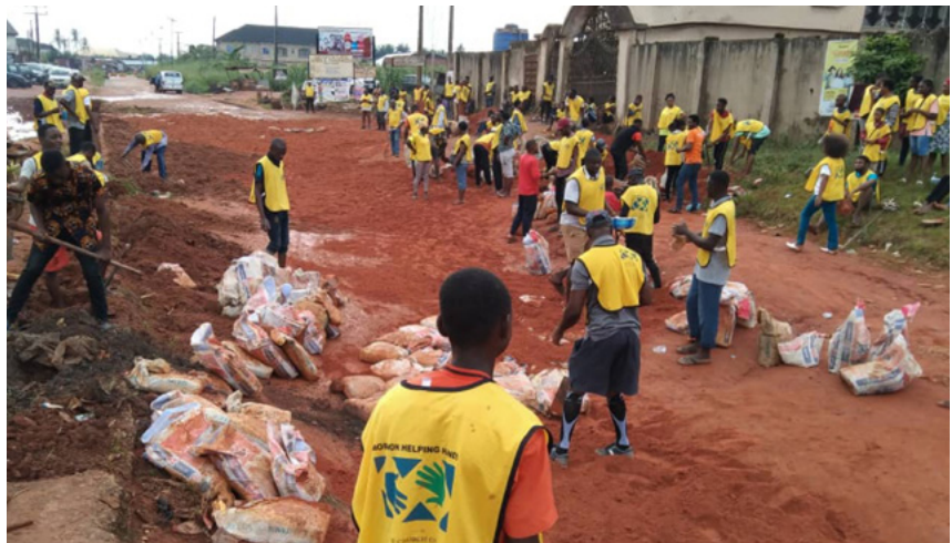
Ci-dessus : au Ghana, des membres de l'Église se sont organisés pour planter 15 000 jeunes pousses lors de la journée spéciale de service de toute l'Afrique (2021 All Africa Service Day).

EN BOLIVIE , les sœurs de la Société de Secours du pieu de Los Andes ont collecté 34 000 bouchons en plastique pour soutenir le projet Niño Feliz, qui aide les enfants pauvres atteints du cancer à recevoir des traitements de chimiothérapie. Les membres de la branche de Khovd en Mongolie sont allés dans le refuge local pour les victimes de violence afin d'y donner des couvertures chaudes, des articles pour les nouveau-nés et des trousseaux d'hygiène.