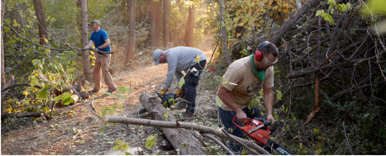
Ci-dessus : des bénévoles d'une assemblée de l'Église à Kaysville (Utah, États-Unis) rassemblent du bois de chauffage dans des zones touchées par la tempête. Il a ensuite été remis aux résidents de la nation Navajo.