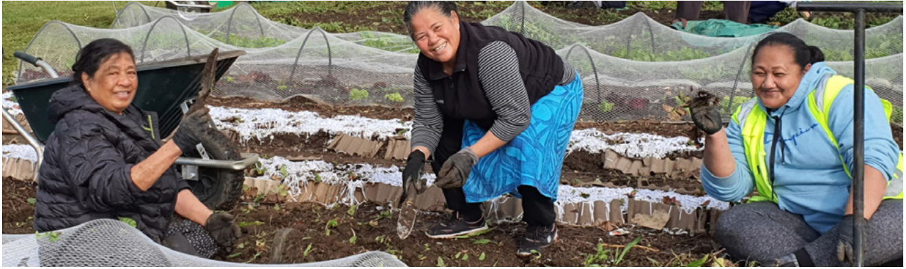
Ci-dessus : des membres de l'Église d'Auckland (Nouvelle-Zélande) ont collaboré avec d'autres organisations pour enlever les mauvaises herbes des jardins et embellir leur collectivité.

« Tu aimeras ton prochain comme toi-même. »