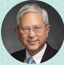
Ni Elder Gerrit W. Gong Ng Korum ng Labindalawang Apostol