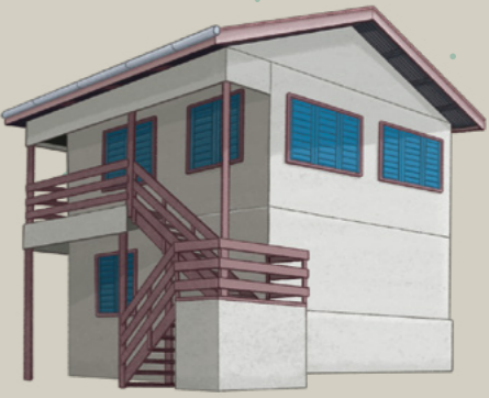
ទីកន្លែង ៖ ផ្ទះដីដូនដីតារបស់គាត់

ដំណើររឿងក្នុងព្រះគម្ពីរ ៖ នៅពេលព្រះយេស៊ូត្រឡប់មកប្រទេសកម្ពុជា