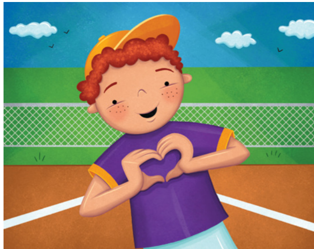
Sa faaloalo Iesu i tagata uma. E mafai ona ou agalelei e pei lava o Iesu.