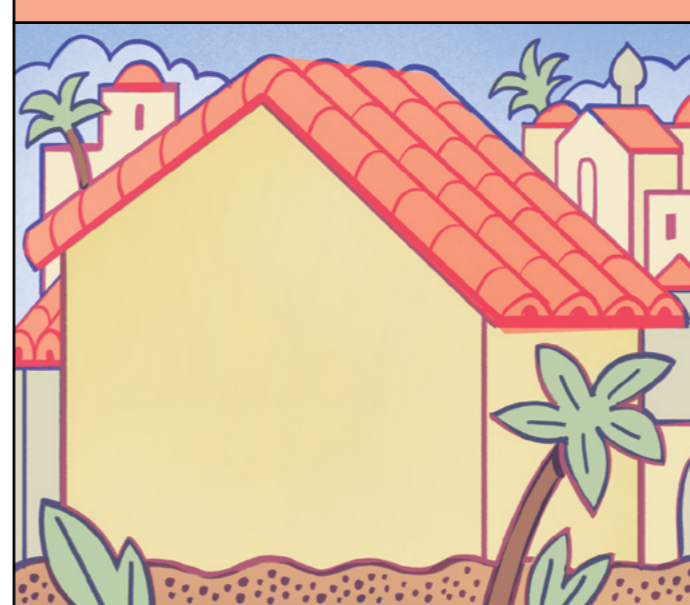
ゲツセマネ (ルカ 22 : 39-46 参照)