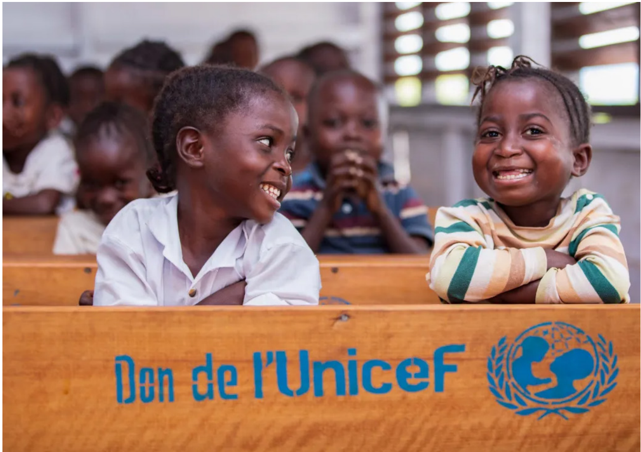
Ibabaw: Duha ka gagmay nga bata sa Habagatang Sudan malipayong nanambong sa ilang bag-ong eskwelahan.

mga sudlanan nga may panglimpyo sa babaye, ug dugang pa. Mga tawo gikan sa tibuok kalibotan miamot, nga may total nga donasyon nga milapas og mga milyon. Lain nga gitotukan sa 2022 mao ang pagpalambo sa amuma sa panglawas sa tibuok kalibotan. Ang American Red Cross nakabaton og bag-ong mga makina alang sa pagkolekta ug paggagam sa mga platelet sa dugo pinaagi sa $5.1 milyon nga donasyon sa Simbahan. Ang pagsiksik sa sakit nga napanunod, grabe nga anemia, panghupong, panakit sa kalawasan [sickle cell] importante kaayo sa pagtabang og kunhod niini nga kondisyon, nga dili bagay ang epekto sa mga miyembro sa komunidad nga kaliwat og Aprikano. Kini nga proyekto gitumong sa pagkab-ot og daghan pa nga mga sakop sa Itom nga komunidad pinaagi sa pagdapit kanila sa pag-apil isip mga tighatag og dugo sa nagpadayon nga mga pagtuon sa pagwagtang niini nga sakit.