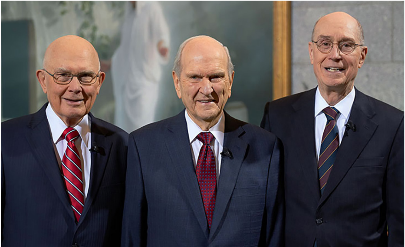
Ibabaw: Si Presidente Russell M. Nelson uban sa iyang duha ka magtatambag, Dallin H. Oaks ug Henry B. Eyring.