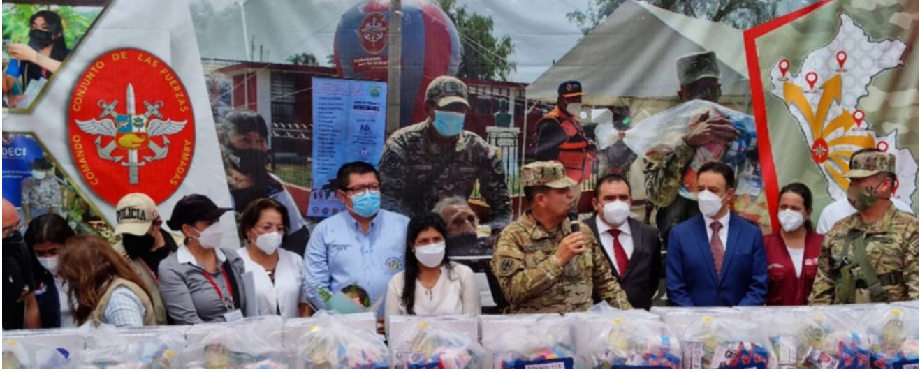
Ibabaw: Usa ka grupo sa mga opisyal nagpundok sa mga donasyon ngadto sa General Hospital sa Barrio Obrero sa Asuncion, Paraguay.