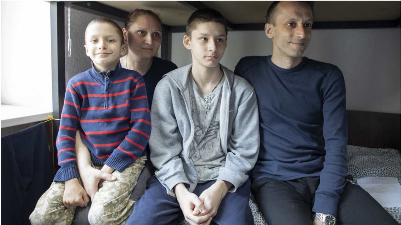
Ibabaw: Usa ka pamilya nga Ukrainian nga nakakaplag og kapoy-an sa laing nasod sa Europe.

“Ang Simbahan ni Jesukristo sa mga Santos sa Ulahing mga Adlaw usa sa labing sinaligan ug dugay na nga mga kauban sa USA alang sa UNHCR. Mag-uban magpadayon kita sa pagpahiuli sa paglaom, kahilwasan, ug dignidad ngadto sa labaw sa 100 ka milyon ka mga indibidwal nga gipugos sa pagpapahawa gikan sa ilang mga panimalay tungod sa pagpanggukod, panag-away, o kapintas.”