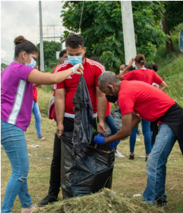
Litrato sa ibabaw: Mga taga-dinha sa Caribbean nagsuportahay sa usag usa human sa epekto sa Hurricane Fiona.