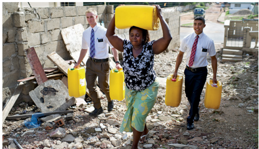
Ibabaw: Duha ka misyonaryo nagserbisyo sa mga tawo sa Ghana, Kasadpang Africa [West Africa].

Ang full-time nga pangsangyaw [proselyting] nga mga misyonaryo nag-apil sa mga proyekto sa serbisyo isip kabahin sa ilang pangalagad-- bulag gikan sa ilang buhat sa pagtudlo mahitungod sa Manluluwas. Kini nga mga misyonaryo nagtabang nga may mga pasiugda nga tubag sa emerhensiya sa ilang pagbangon.