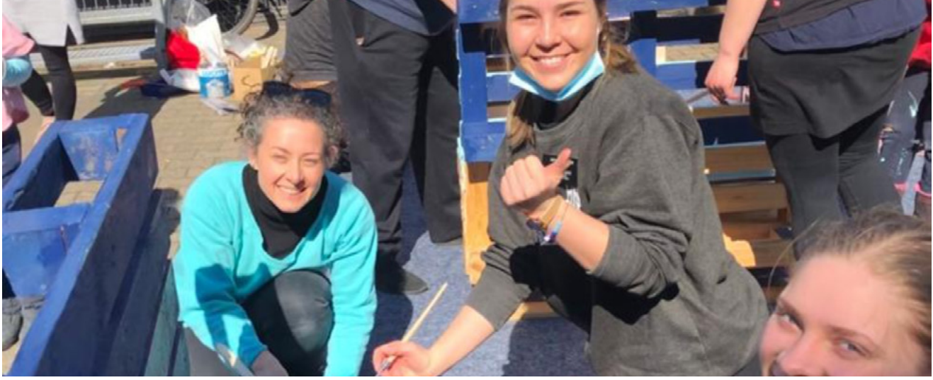
Ibabaw: Usa ka grupo sa pangserbisyo nga mga misyonaryo nagpintal og mga muwebles sa Caritas nga sentro sa walay panimalay nga bakwit sa Friedrichsdorf, Germany.