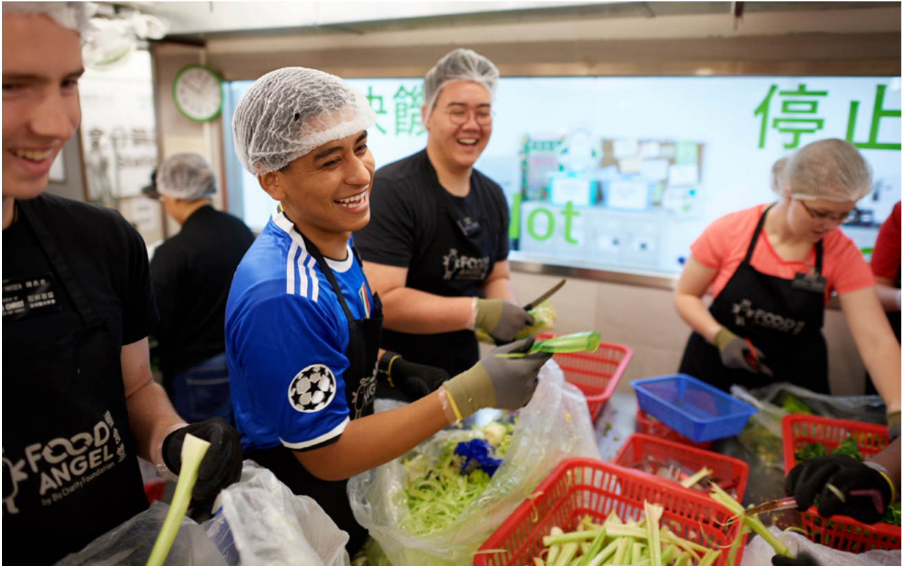
Ibabaw: Mga misyonaryo nagtabang sa pag-andam sa pagkaon atol sa usa ka proyekto sa serbisyo sa Honkong.

“Karon mao ang panahon nga kita makapanalangin sa uban ug ‘ipataas ang mga kamot sa nawad-an og paglaom.”