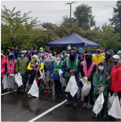
Ibabaw: Diha sa lainlaing relihiyon nga adlaw sa pagpunit sa mga basura sa Portland, Oregon, ang mga boluntaryo nagkuyog sa pag-anha sa pagkolekta tali sa 500 ug 600 ka libra sa basura.

“Sa mga panahon sa mas nagkadako nga pagkabahin ... ang pagkamaukiton mahitungod sa ug pagsabot sa mga panan-awon sa pagtuo sa atong mga silingan o pagka-espirituhanon nagtugot kanato nga mahimong mas maayong mga silingan.”