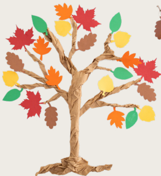
ម្ដេចចង់ត្រូវជាសព្វពិរិយាធ្វើដើមឈើដាក់លើជញ្ជាំងរបស់អ្នក ។

ធ្វើដើមឈើនៃការដឹងគុណ ! សរសេរអ្វីដែលប្អូនមានអំណរគុណនៅលើស្លឹកនីមួយៗ ។ បន្ទាប់មកកាត់ស្លឹកទាំងនោះហើយព្យួរនៅលើដើមឈើ ។ អ្នកអាចគូសដានរាងស្លឹកឈើ ដើម្បីធ្វើស្លឹកបន្ថែមទៀត ។