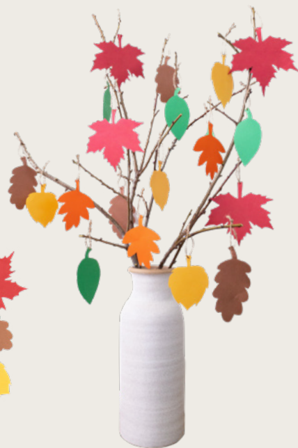
ឬក៏ដាក់មែកឈើតូចៗនៅក្នុងចូ ហើយចងស្លឹកជាប់មែកទាំងនោះ ។