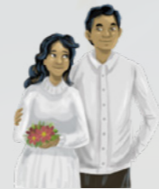
Na'e fakahū 'e Filipe mo hono uai'fi ha pa'anga 'i ha ta'u 'e taha koe'uhí ke na lava 'o fononga ki he tempalé ke sila ai.

Na 'e mahino ki he 'ene fa'eé. Na 'e 'uhinga 'a e 'ulu niú na 'e ofi