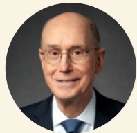
Fai 'e Palesiteni Henry B. Eyring Tokoni Ua 'i he Kau PalesitenisĪ 'UluakĪ

FOHE'ULÍ: ko ha fohe pe me'a 'okú ne faka'uli ha vaka