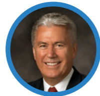
B. Elder Dieter F. Uchtdorf