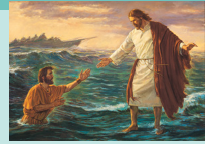
HISTORIE OM JESUS: Da Jesus gik på vandet