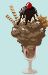
MAD: Nudler, isdesserter