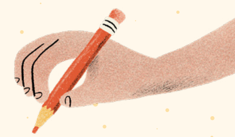
LĒSONI 'I HE AKÓ: 'Ātí