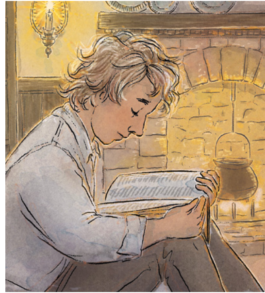
រាប់រយឆ្នាំក្រោយមក យ៉ូសែប ស្ទីដ បានអានសំបុត្ររបស់យ៉ាកុប នៅក្នុងព្រះគម្ពីរលើ ។