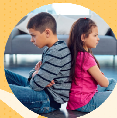
COME UNTO JESUS (DUOL NGADTO NI JESUS), NI MICHAEL MALIM