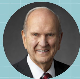
Presidente Russell M. Nelson

Gikuha gikan sa “Paghunahuna og Celestial!” Liahona, Nob. 2023, 115-17.