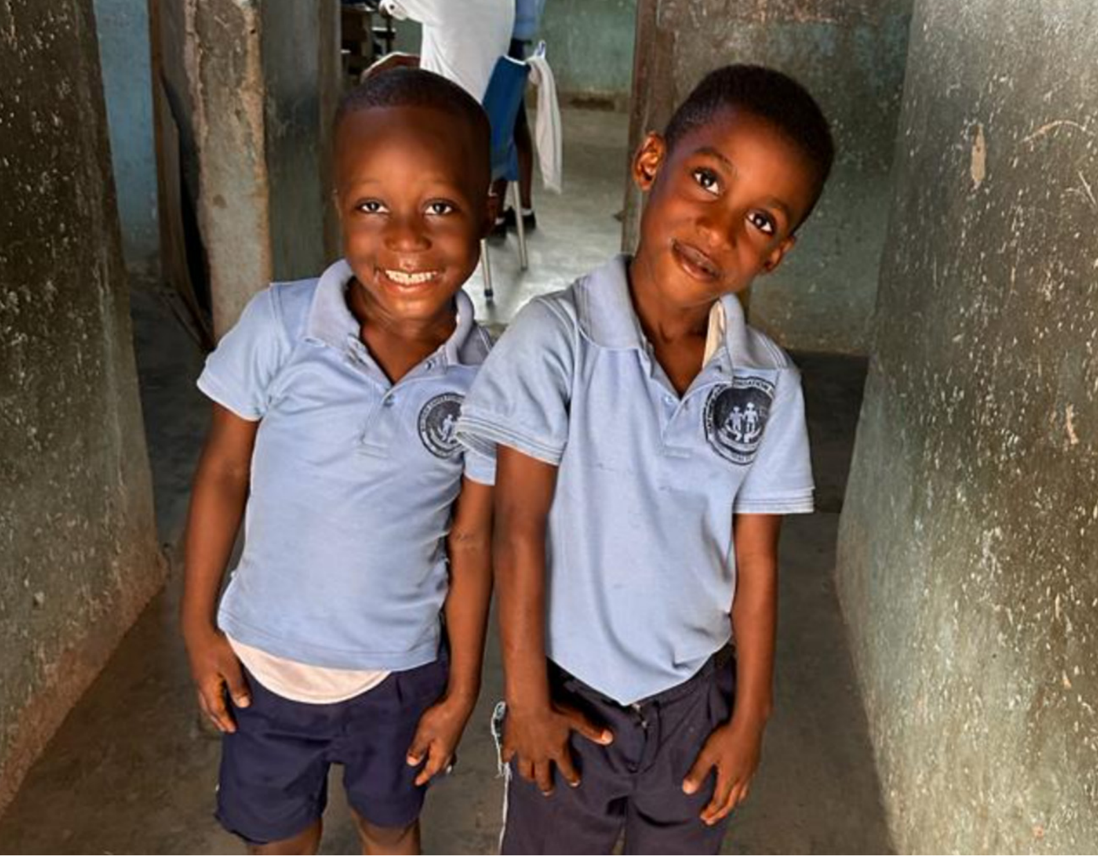
Ang kabataan nakadawat og edukasyon sa sulod sa kampo sa bakwit sa Liberia sa Ghana.