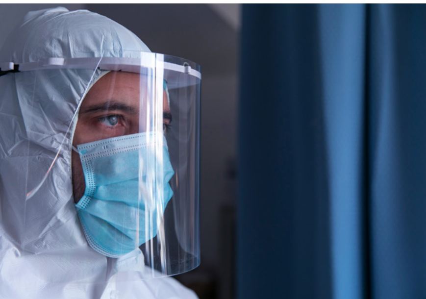
Usa ka doktor sa Dominican Republic nangandam sa pagpahigayon og medikal nga pamaagi.