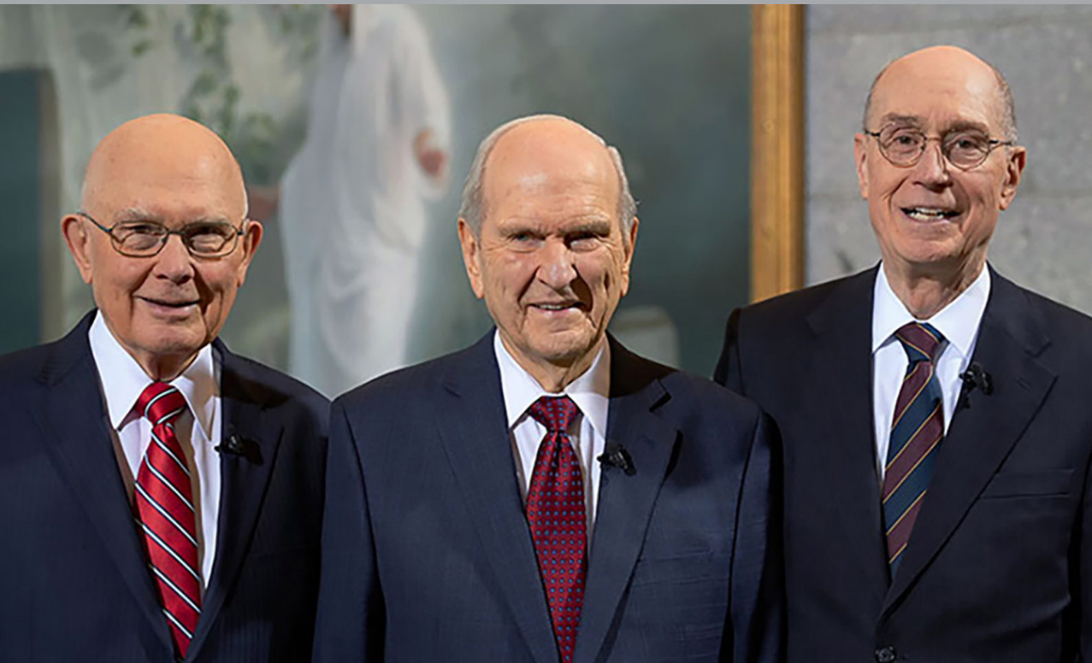
Si Presidente Russell M. Nelson uban sa iyang duha ka magtatambag, Presidente Dallin H. Oaks ug Presidente Henry B. Eyring.