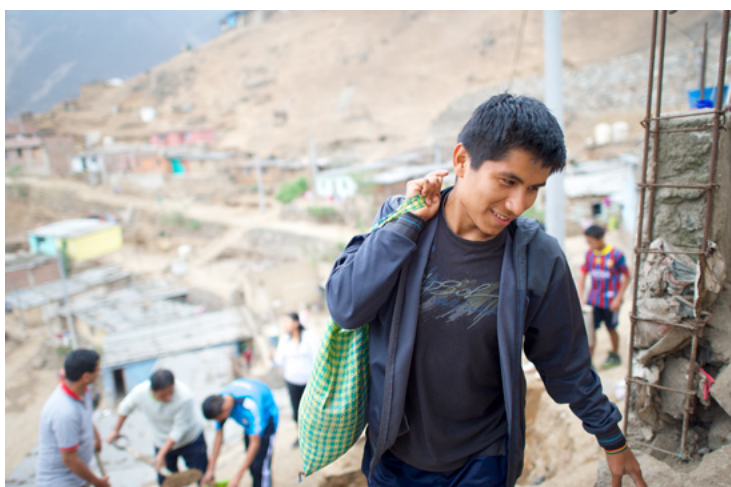
Usa ka batan-ong lalaki miapil sa usa ka proyekto sa pagserbisyo sa Peru.

Sa tuig 2023, ang mga miyembro sa Simbahan sa Central ug South America miapil sa kampanya sa pagdonar og dugo sa pagsuporta sa lokal nga mga ospital ug mga pasyente. Ang Simbahan misangkap usab og ekipo, pagbansay, ug ubang suporta sa medikal nga mga pasilidad ug mga inisyatibo sa pag-atiman sa kahimsog sa tibuok rehiyon. Sa El Salvador, pananglitan, ang Simbahan nakig-alayon sa National Institute of Santa Ana sa paghatag og mga antyohos sa gatosan ka estudyante.