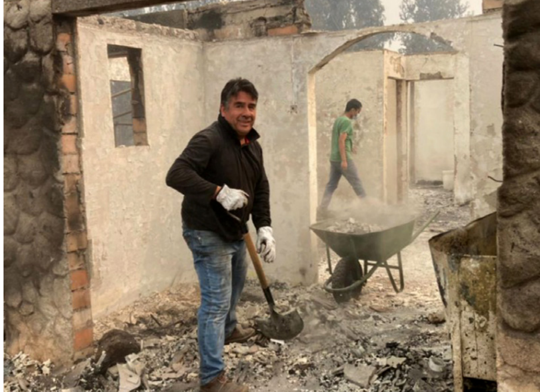
Sa wala: Ang mga estudyante sa El Salvador nakadawat og mga antyohos. Sa tuo: Usa ka lalaki mitabang sa pagpanglimpyo human sa dakong sunog sa Chile.

Ang Simbahan naningkamot usab sa pagpaayo sa mga klasrom ug paghatag sa gidonar nga ekipo aron matabangan ang pagkat-on sa mga estudyante. Sa Panama, pananglitan, ang Simbahan midonar og gatosan ka kompyuter ngadto sa Ministry of Education, nagtabang sa gatosan ka estudyante nga makadawat og mas dakong access sa mga oportunidad sa online nga pagkat-on .