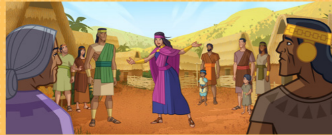
Wybiegła na dwór i powiedziała ludziom, aby zobaczyli cud, który wydarzył się u królowej i króla.