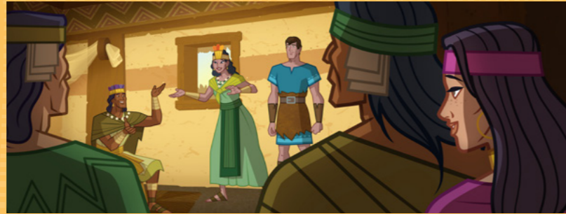
Pewnego dnia Abisz zobaczyła Ammona, który nauczał o Jezusie Chrystusie. Wszyscy, którzy słuchali, tak silnie odczuwali Ducha, że padli na ziemię.