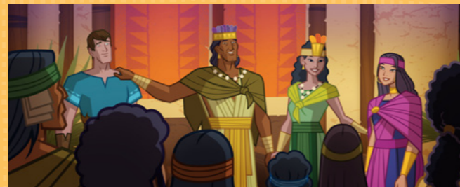
Król i królowa podzielili się z innymi ludźmi swoimi świadectwami o Jezusie Chrystusie. (Zob. Ks. Almy 19:16–17, 28–31). ●