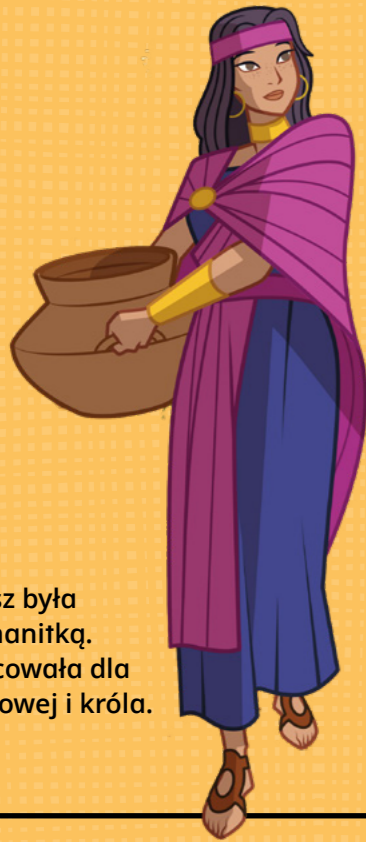
Abisz była Lamanitką. Pracowała dla królowej i króla.