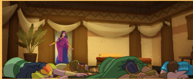
Abisz już uwierzyła w Jezusa Chrystusa. Wiedziała, że moc Boga sprawiła, iż inni ludzie upadli na ziemię.