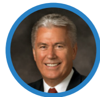
B. Elder Dieter F. Uchtdorf