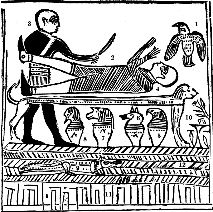
ຄຳອະທິບາຍ