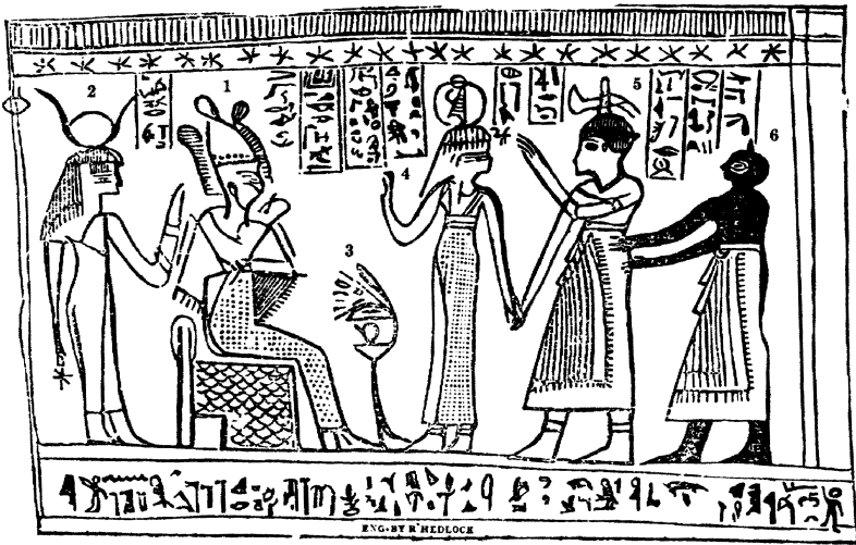
ຄຳອະທິບາຍ

ຮູບທີ 1. ອັບຣາຮາມນັ່ງຢູ່ເທິງບັນລັງຂອງຟາໂຣ, ໂດຍອັດທະຍາໄສຂອງກະສັດ, ພ້ອມດ້ວຍມົງກຸດຢູ່ເທິງຫົວຂອງເພິ່ນ, ສະແດງເຖິງຖານະປະໂລຫິດ, ເປັນເຄື່ອງໝາຍສະແດງເຖິງຝ່າຍປະທານທີ່ຍິ່ງໃຫຍ່ໃນສະຫວັນ; ພ້ອມດ້ວຍໄມ້ຄ້ອນເທົ້າແຫ່ງອຳນາດແຫ່ງຄວາມຍຸດຕິທຳ ແລະ ການພິພາກສາໃນມືຂອງເພິ່ນ.