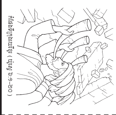
( ០១:១១ ) លូកា