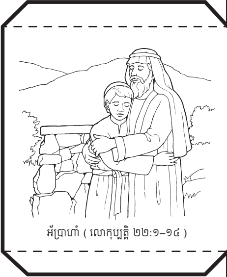
អ៊ីប្រាហាំ ( លោកុប្បវត្តិ ២២:១-១៤ )