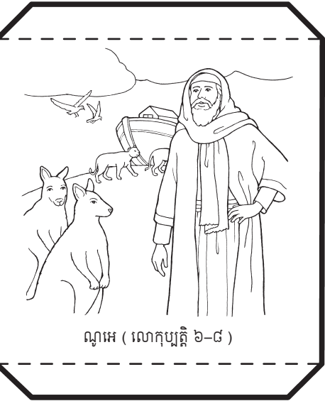
ណាអេ ( លោកុប្បវត្តិ ៦-៨ )