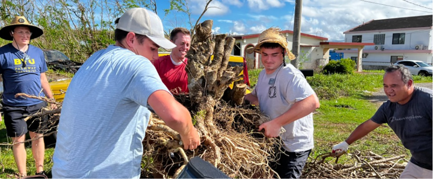
Nilinis ng mga miyembro ng Simbahan sa Guam ang komunidad pagkaraan ng Typhoon Mawar.

Naniniwala ang mga miyembro ng Ang Simbahan ni Jesucristo ng mga Banal sa mga Huling Araw sa pagsunod sa dalawang dakilang utos ng Tagapagligtas: mahalín ang Diyos at mahalín ang ating kapwa. Ipinapakita ng mga miyembro ang kanilang pagmamahal sa pamamagitan ng ministering.