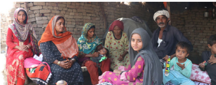
Nagtipon ang isang pamilya sa Pakistan sa isang kanlungan matapos silang mawalan ng tirahan dahil sa pagbaha.

Ang pagkakawanggawa ng Simbahan sa Morocco ay nagkakaroon ng malaking epekto sa mga bahagi ng populasyon na madalas balewalain ng lipunan. Bukod sa iba pang mga pagsisikap noong 2023, naglaan ang Simbahan ng mga lugar para sa aktibidad sa labas at ng mga dormitoryo para sa Passerelle Autistic Center. Tinuturuan ng center na ito ng mga pangunahing skill ang mga kabataang may autism para mas makaasa sila sa sarili, gayundin ng mga espesyal na kasanayan sa pagsasaka, sports, musika, at sining. Ang mga pagsisikap na ito ay nagdaragdag sa kakayahang matanggap sa trabaho at mapahusay ang kalidad ng buhay para sa mga kabataang residente ng center.