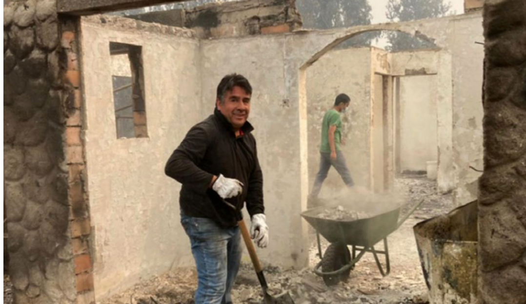
Kaliwa: Tumanggap ng mga salamin sa mata ang mga estudyante sa El Salvador. Kanan: Tumulong ang isang lalaki sa paglilinis pagkaraan ng isang wildfire sa Chile.

Nagsikap din ang Simbahan na ayusin ang mga silid-aralan at nag-donate ng kagamitan para makatulong sa pag-aaral ng mga estudyante. Sa Panama, halimbawa, nag-donate ang Simbahan ng daan-daang computer sa Ministry of Education, na nakatulong sa daan-daang estudyante na mas madaling maka-access sa mga oportunidad na mag-aral online.