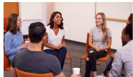
Kaliwa: Nakangiti ang isang dalagita habang hinahangaan nila ng kanyang mga kaibigan ang tanawin. Gitna: Isang miting ng grupo sa addiction recovery. Kanan: Namuno at nakilahok ang mga miyembro ng Simbahan sa isang kurso sa emosyonal na katatagan.