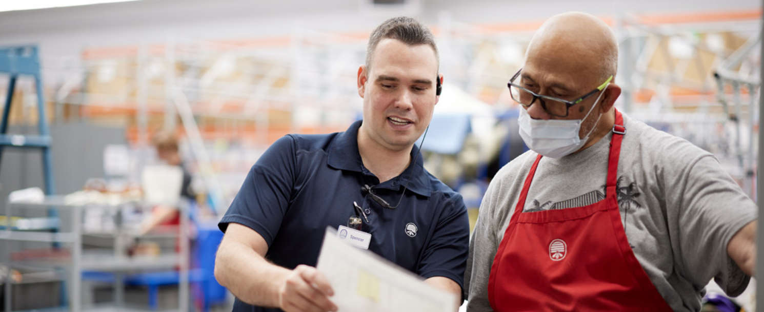
Tinulongan ng isang job coach ang isang Deseret Industries associate na ayusin ang na-donate na mga item.