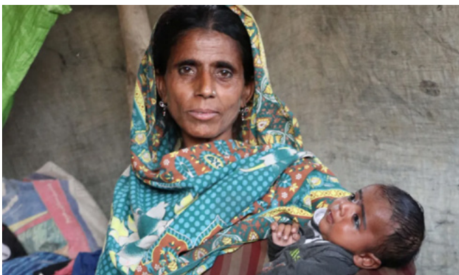
Nanirahan ang isang mag-ina sa isang pansamantalang kanlungan matapos wasakin ng baha ang kanilang tahanan at mga ari-arian sa Pakistan.

Noong Mayo, libu-libong mga tao sa Malawi ang nawalan ng tirahan nang maapektuhan ng isang 36-na-araw na tropikal na bagyo (ang pinakamahaba sa nakatalang kasaysayan). Bukod pa sa paglalaan ng mga tolda, kumot, at suporta sa mga mobile clinic, kinanlong din ng Simbahan ang daan-daang miyembro ng komunidad na nawalan ng kanilang tahanan. Namigay ng pagkain ang mga miyembro ng Simbahan sa mga taong ito, nagsaayos ng paglalakbay para tulungan ang ilan na makasama ang mga kapamilya, at pinangalagaan ang iba hanggang sa makahanap sila ng angkop na tirahan.