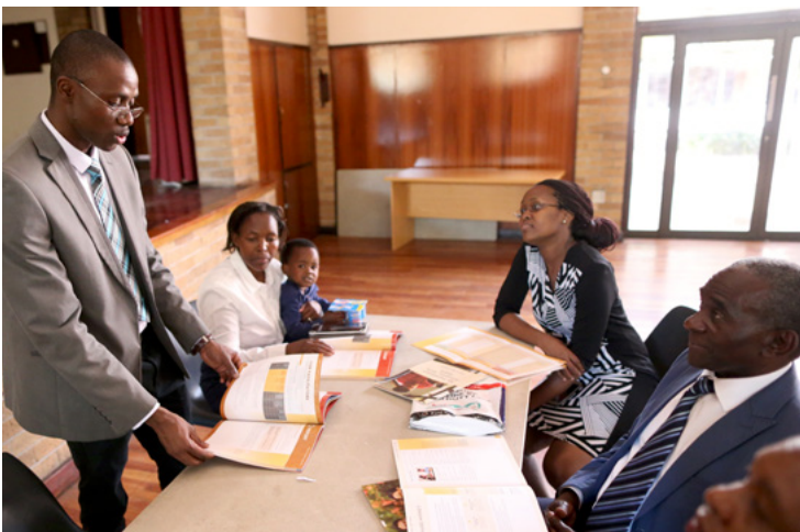
Nagtipon ang isang self-reliance group sa South Africa.

Sa South Dakota, halimbawa, nag-donate ang Simbahan ng mga kagamitan sa pagpoproseso ng pagkain sa mga miyembro ng tribo ng Sisseton-Wahpeton Oyate para bigyan sila ng karagdagang kaparaanan para suportahan ang kanilang sarili. Nakipagtulungan din ang Simbahan sa nonprofit na organisasyon na Upwardly Global para tulungan ang mga immigrant sa buong Estados Unidos na tumanggap ng mga kredensyal para makapagtuloy sa kanilang propesyon bilang mga doktor, dentista, guro, o iba pang mga tungkulin.