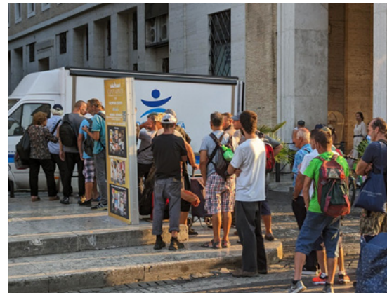
Kaliwa: Tumanggap ng emosyonal na suporta ang isang grupo ng mga refugee na taga-Ukraine mula sa mga counselor. Kanan: Naghintay sa pila ang mga indibiduwal na nawalan ng tirahan sa Rome para tumanggap ng pagkain at damit.