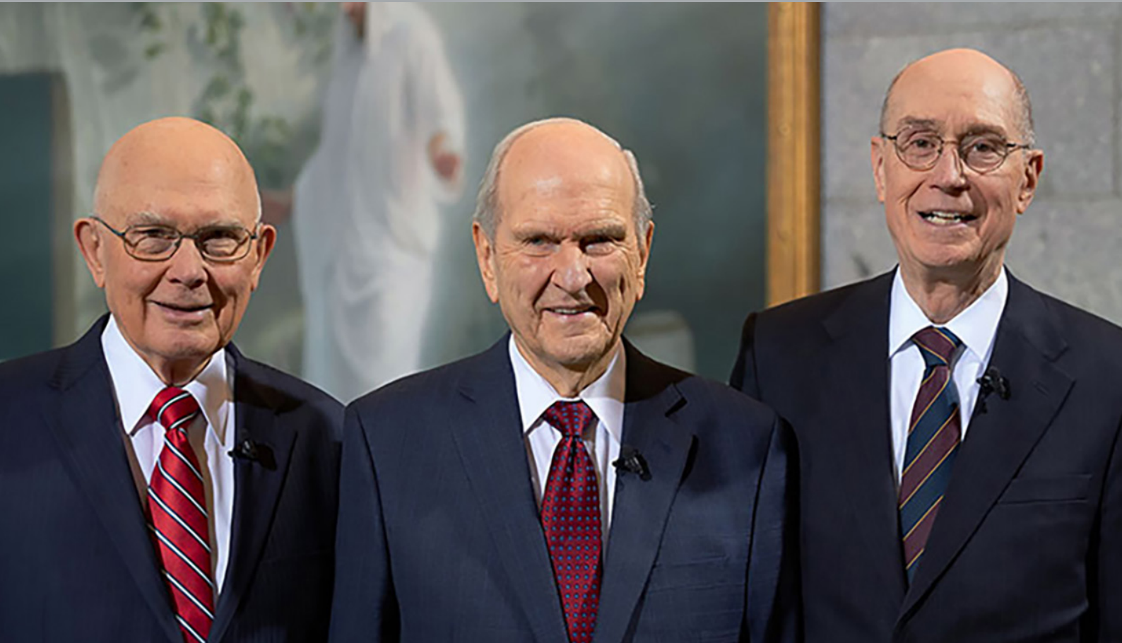
Si Pangulong Russell M. Nelson kasama ang dalawa niyang tagapayo, sina Pangulong Dallin H. Oaks at Pangulong Henry B. Eyring.