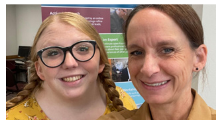
Kaliwa: Nagtipon ang mga naghahanap ng trabaho sa isang employment center para dumalo sa isang Active Job Search group meeting. Gitna: Isang lalaki sa Mexico ang nagtatrabaho sa isang restawran. Kanan: Isang young service missionary at senior missionary, na tinawag na maglingkod sa Employment Services.