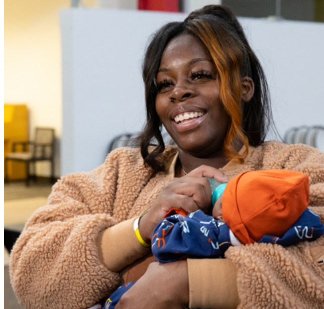
Kaliwa: Nagsilbi ng hapunan ang mga boluntaryo sa Old Brewery Mission sa Quebec. Kanan: Isang babae at ang kanyang sanggol sa The Chicago Citywide Community Baby Shower.

Sa Estados Unidos, nag-donate ng pondo ang Simbahan sa Feeding America para tumulong sa pagbili ng mga pagkain para sa mga nangangailangan. Nag-donate din ang Simbahan ng daan-daang trak ng mga produkto sa mga network ng pangunahing food bank sa buong bansa.