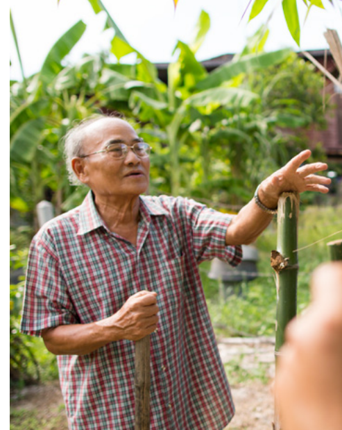
Kaliwa: Tumanggap ng vision care ang isang pamilya sa isang eye care center sa India. Kanan: Nagtatrabaho ang dalawang lalaki sa Thailand sa kanilang halamanan.