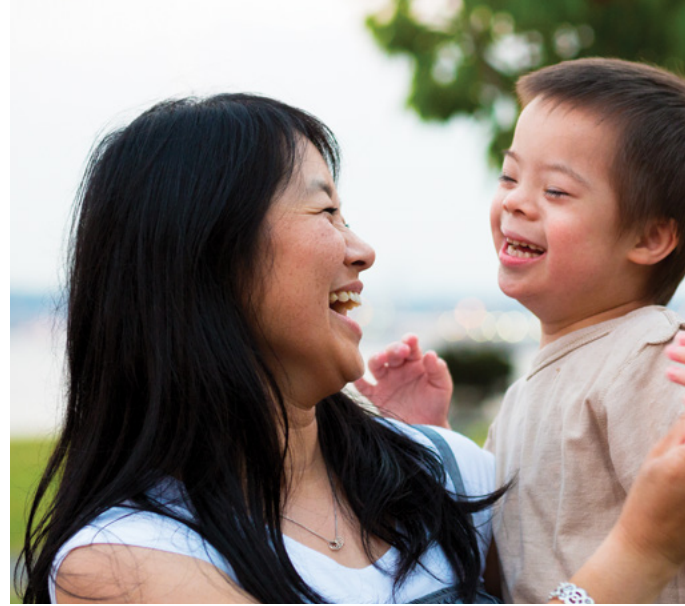
Mga ina na yakap ang kanilang mga anak.

921 proyektong pangkawanggawa na nakatuon sa kababaihan at mga bata