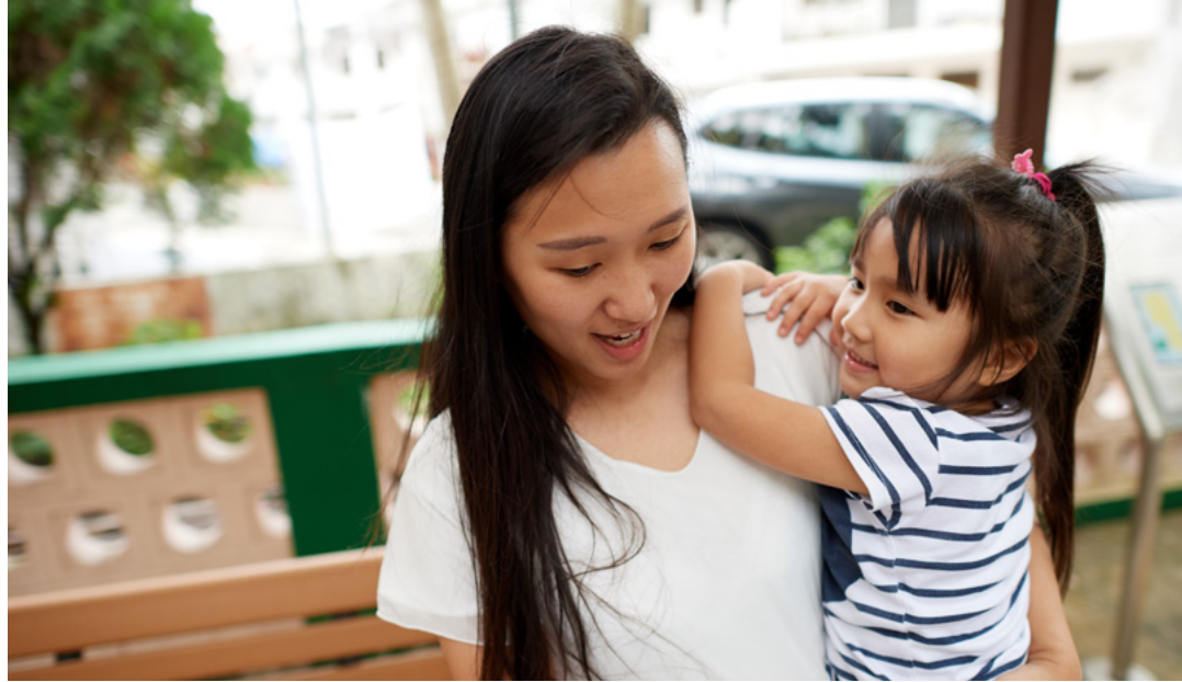
Isang mag-ina sa isang parke sa Hong Kong.