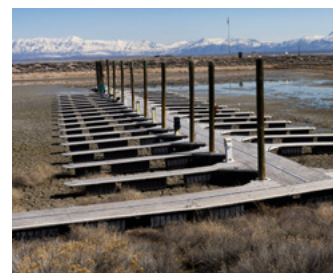
Kaliwa: Isang ina at ang kanyang mga anak na sama-samang nagbibisikleta sa Japan. Gitna: Nagtanim ng mga bulaklak ang isang young Church service missionary sa paligid ng Ogden Temple. Kanan: May mga dock sa tuyong lupa sa Great Salt Lake.