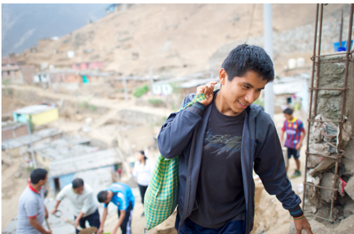
Nakilahok ang isang binatilyo sa isang service project sa Peru.