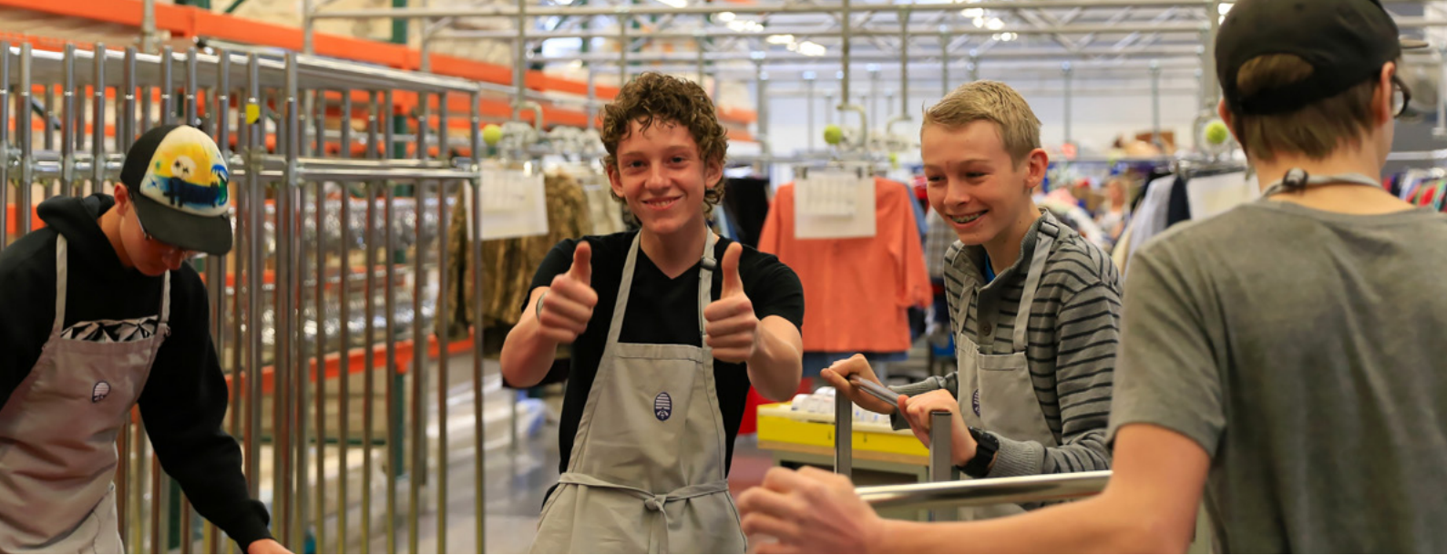
Nagboluntaryo ng kanilang oras ang mga kabataang lalaki, na nag-aayos ng mga donasyon sa kanilang lokal na Deseret Industries store.