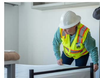
Kaliwa: Binigyan ang isang pamilyang nawalan ng tirahan sa Syria ng shelter kit at iba pang mga kinakailangang materyales. Kanan: Tumulong ang mga lokal na boluntaryo na maghanda ng mga kama sa isang kanlungan para sa mga walang tirahan sa California.