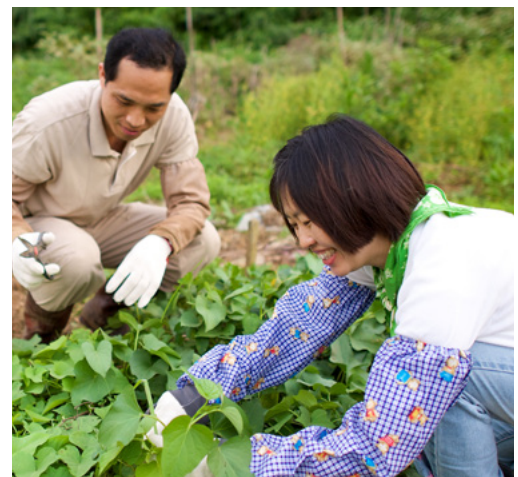
Nagtatrabaho ang isang mag-asawa sa kanilang halaman sa Taiwan.