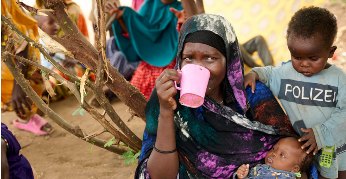
Tumanggap ng pangangalaga ang isang mag-ina sa isang refugee camp sa Kenya.