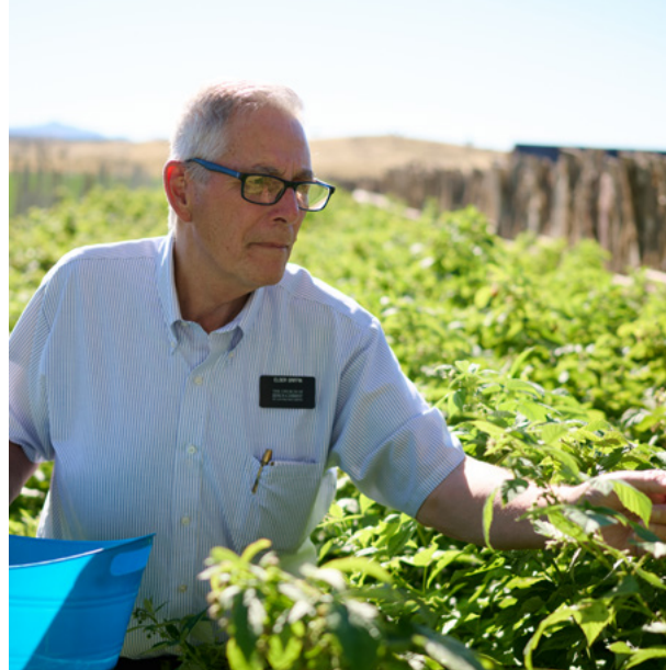
Kaliwa: Nasiyahan ang isang bata sa Haiti sa masustansyang pagkain sa paaralan. Kanan: Namitas ng berries ang isang senior missionary sa isang sakahang pag-aari ng Simbahan.

530 mga proyekto sa seguridad ng pagkain