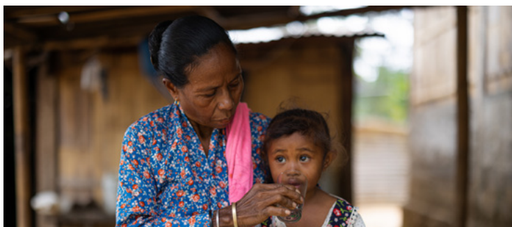
Kaliwa: Naghuhugas ng kamay ang isang babae at batang babae. Kanan: Tinutulungan ng isang babae ang kanyang apog babae na uminom ng malinis na tubig mula sa gripo sa Timor-Leste.