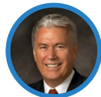
B. Elder Dieter F. Uchtdorf