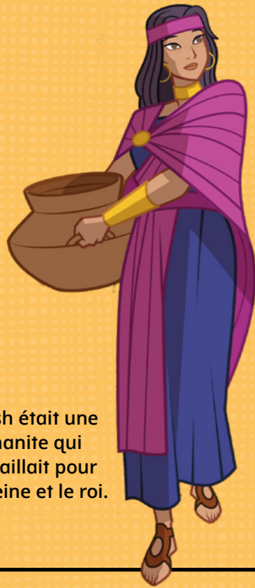
Abish était une Lamanite qui travaillait pour la reine et le roi.