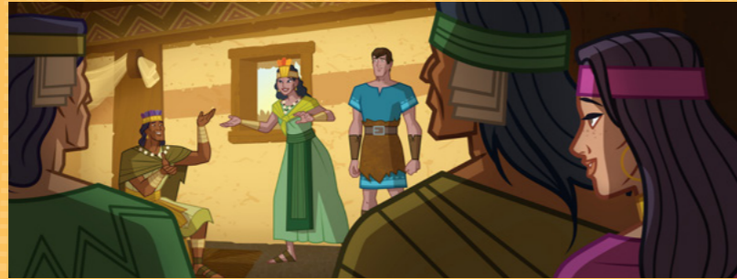
Un jour, Abish a entendu Ammon leur parler de Jésus-Christ. Toutes les personnes qui écoutaient ont ressenti l'Esprit avec une telle force qu'elles sont tombées par terre.