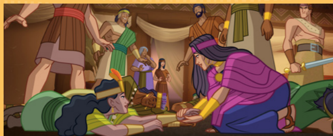
Elle a aidé la reine à se lever.