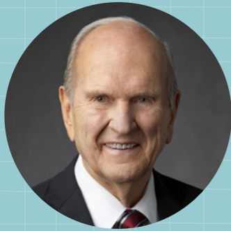
Nosoratan'ny Filoha Russell M. Nelson