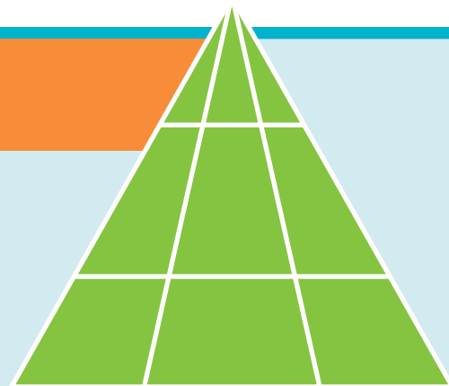
Tali o loo i le itulau 31. Tali e vaaia i le ftsoy.ChurchofJesusChrist.org .

E fia ni tafatolu e mafai ona e vaai i ai?