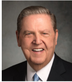
Jeffrey R. Holland