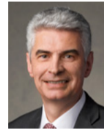
Gérald Caussé Uskup Ketua