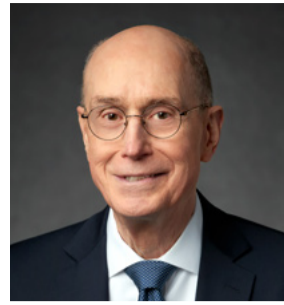
Henry B. Eyring Penasihat Kedua