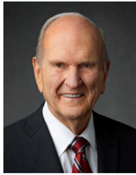
Russell M. Nelson Presiden