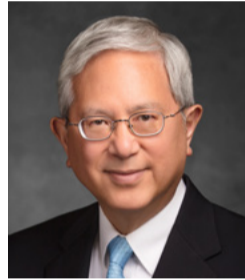
Gerrit W. Gong