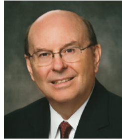
Quentin L. Cook