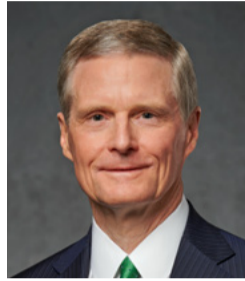
David A. Bednar