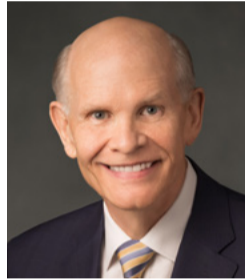
Dale G. Renlund