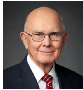
Dallin H. Oaks Penasihat Pertama