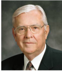
M. Russell Ballard