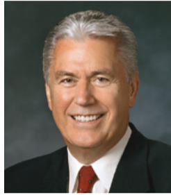
Dieter F. Uchtdorf