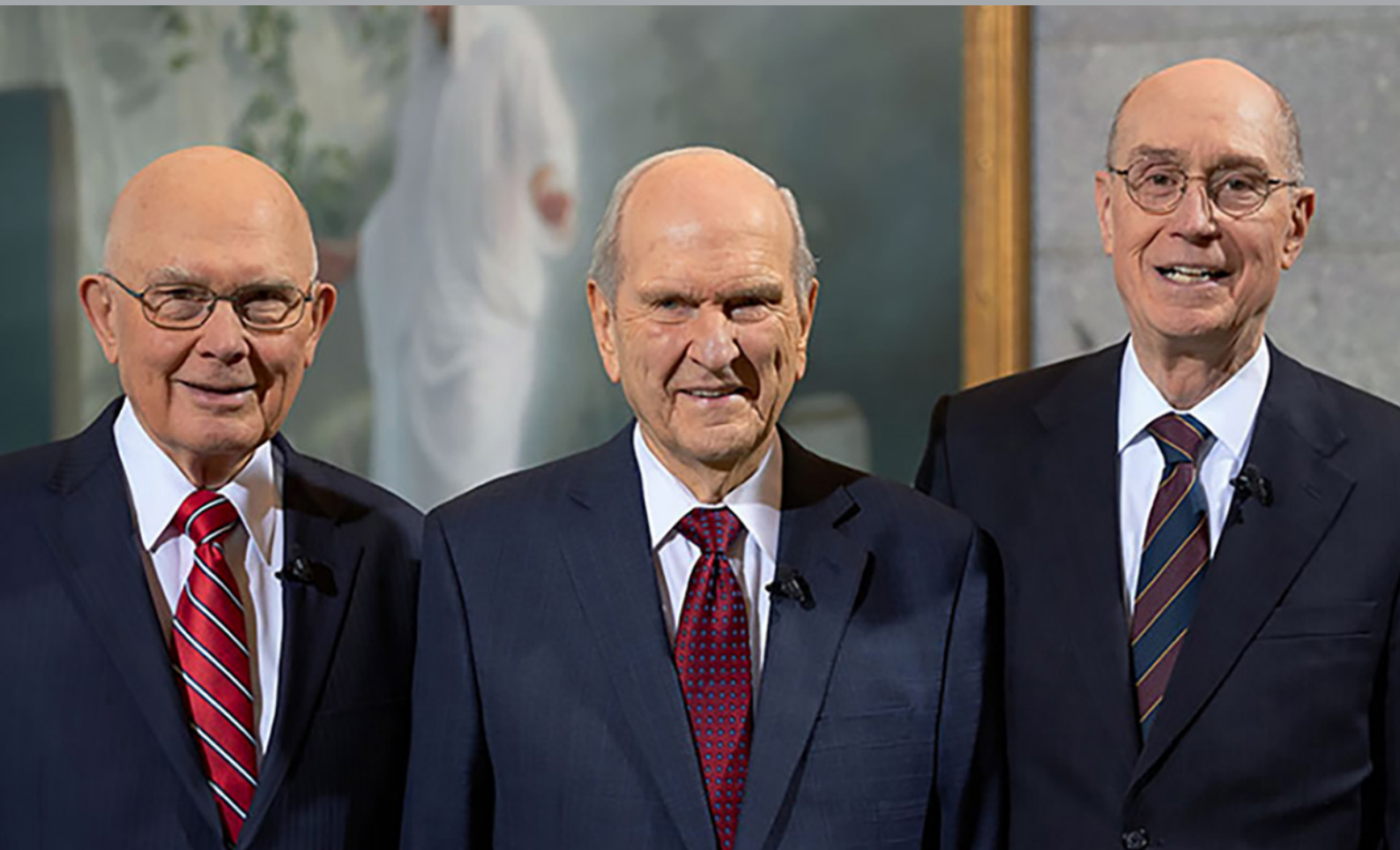
El presidente Russell M. Nelson con sus dos consejeros, el presidente Dallin H. Oaks y el presidente Henry B. Eyring.