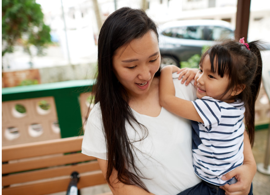
Una madre y su hija en un parque de Hong Kong.

y escolares de Tov Aimag para proporcionar mil mochilas a los jóvenes alumnos cuyos padres no podían costear los útiles escolares.