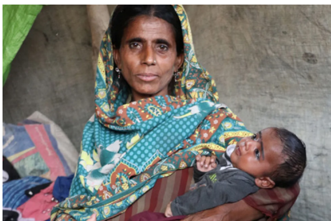
Una madre y su hijo viven en un refugio provisional después de que una inundación destruyera su hogar y sus pertenencias en Pakistán.