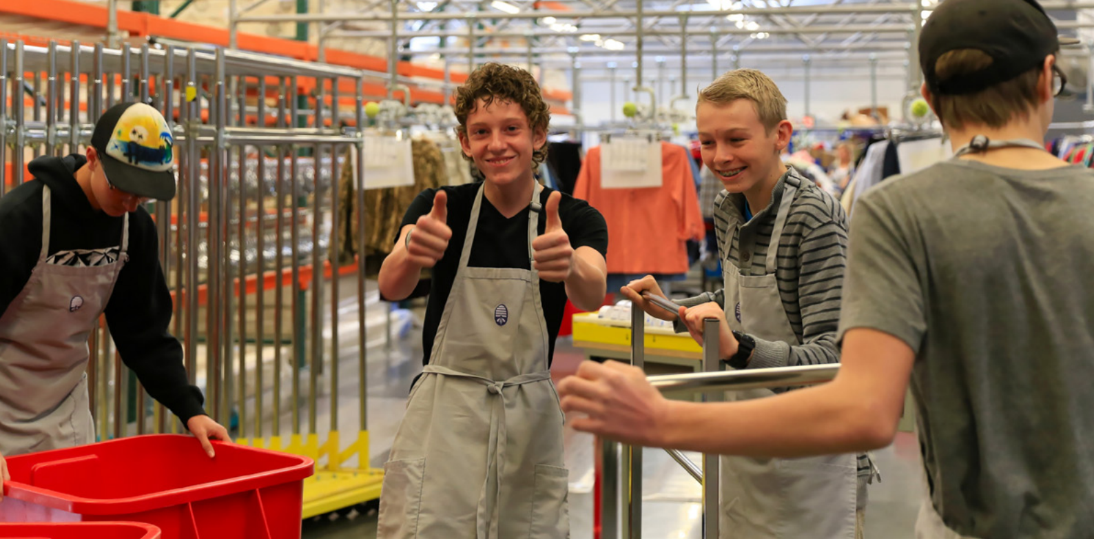
Unos jóvenes ofrecen su tiempo y clasifican las donaciones en la tienda local de Deseret Industries.