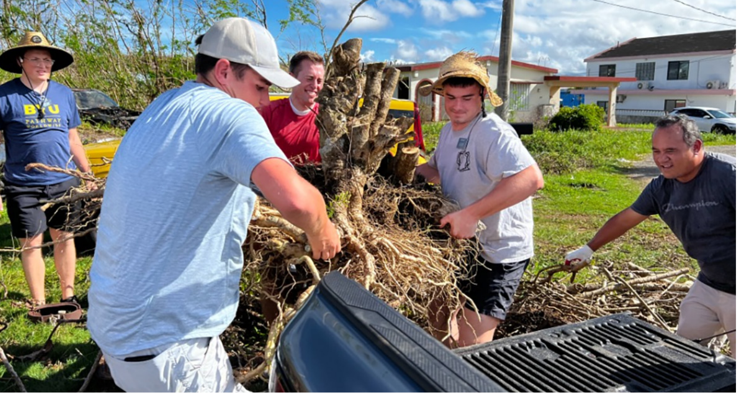
Miembros de la Iglesia en Guam limpian la comunidad tras el tifón Mawar.

Los miembros de La Iglesia de Jesucristo de los Santos de los Últimos Días creen en seguir los dos grandes mandamientos dados por el Salvador: amar a Dios y amar al prójimo. Los miembros demuestran su amor por medio de la ministración.