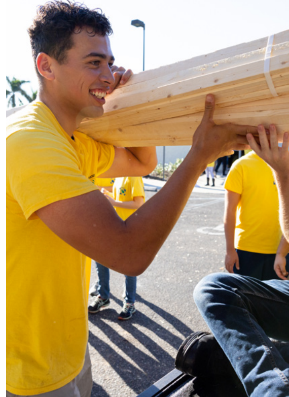
Izquierda: Un miembro de la Iglesia de Maui lleva suministros donados para ayudar en las labores de socorro por los incendios forestales. Derecha: Unos voluntarios recogen materiales para ayudar a las víctimas de huracanes en Florida.