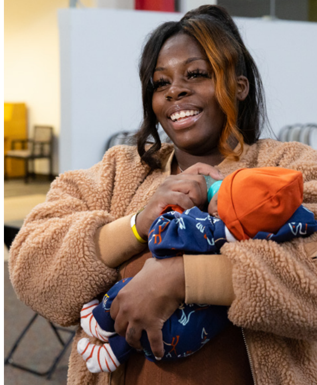
Izquierda: Unos voluntarios sirven la cena en la Old Brewery Mission, en Quebec. Derecha: Una mujer y su bebé en la fiesta por el nacimiento de bebés comunitaria de la ciudad de Chicago.

hizo donaciones en efectivo a los bancos de alimentos de Fort Saskatchewan y Daily Bread para ayudarlos a ampliar su capacidad de distribución.