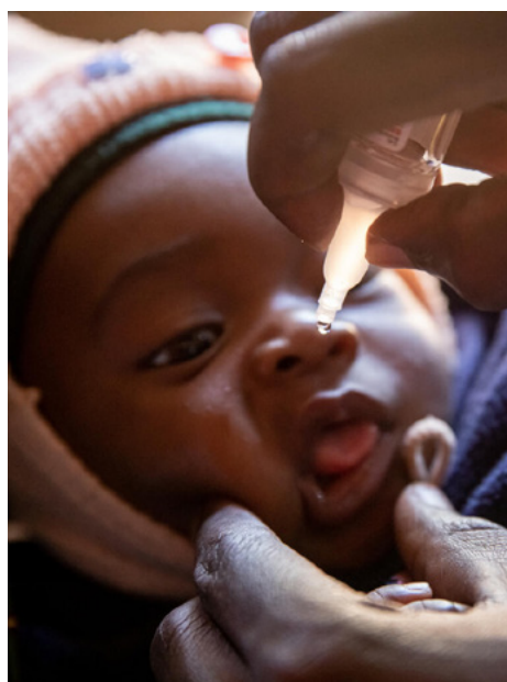
Un profesional sanitario administra la vacuna contra la poliomielitis a un bebé en Zambia.

Esta fue solo una de las varias donaciones que realizó la Iglesia en 2023 y que han tenido impacto en miles de personas en todo el mundo.