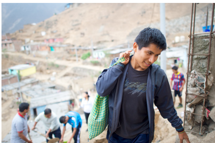
Un joven participa en un proyecto de servicio en Perú.