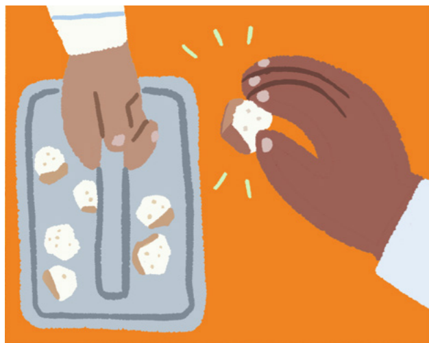
Ni'u lako ki lotu, au rawa ni vakayagataka na sakaramede.