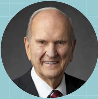
Na Rais Russell M. Nelson