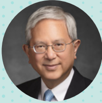
Ældste Gerrit W. Gong De Tolv Apostles Kvorum