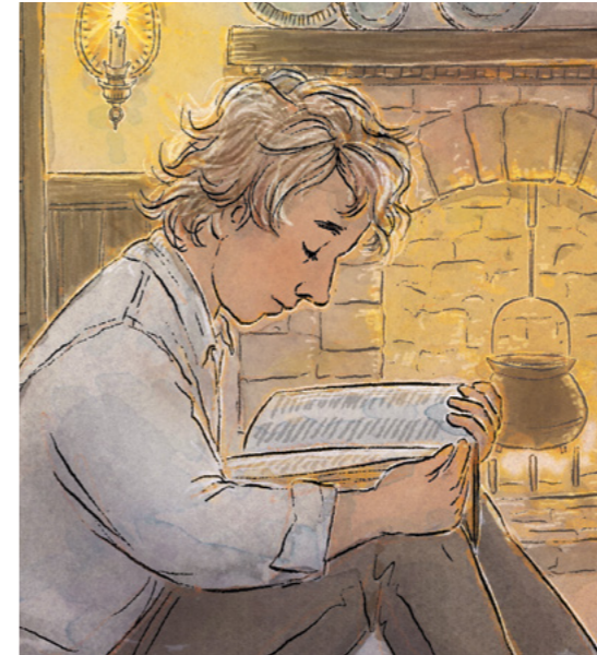
Mamia ya miaka baadaye, Joseph Smith alisoma barua ya Yakobo katika Biblia.