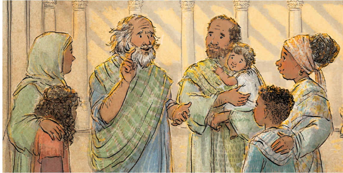
Yakobo alikuwa Mtume. Aliwafundisha wengine kuhusu Yesu Kristo. Aliandika barua kwa watu waliomwamini Yesu