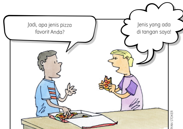
Solusi visual di fsoy.ChurchofJesusChrist.org .

Juruselamat hendak mengunjungi negeri orang-orang Nefi. Tetapi saat ini, ada banyak kehancuran. Dapatkah Anda menemukan 10 benda tersembunyi dalam reruntuhannya? (Lihat 3 Nefi 8–11 untuk kisahnyal)