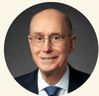
だい かん ちょう かい だい に こもん 大 管 長 会 第 二 顧 問 ヘンリー・B・ アイリング 管 長

の教会の長はイエス・キリストです。 主は預言者に語りかけることによって、御自分の教会をみちびかれます。主はけいじを通して預言者に語られます。 主は遠い昔、預言者にけいじをあたえられました。今もそうされ