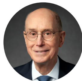
Prezydent Henry B. Eyring Drugi Doradca w Pierwszym Prezydium