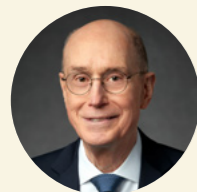
President Henry B. Eyring Tweede raadgever in het Eerste Presidium

Jezus Christus is het hoofd van de kerk.