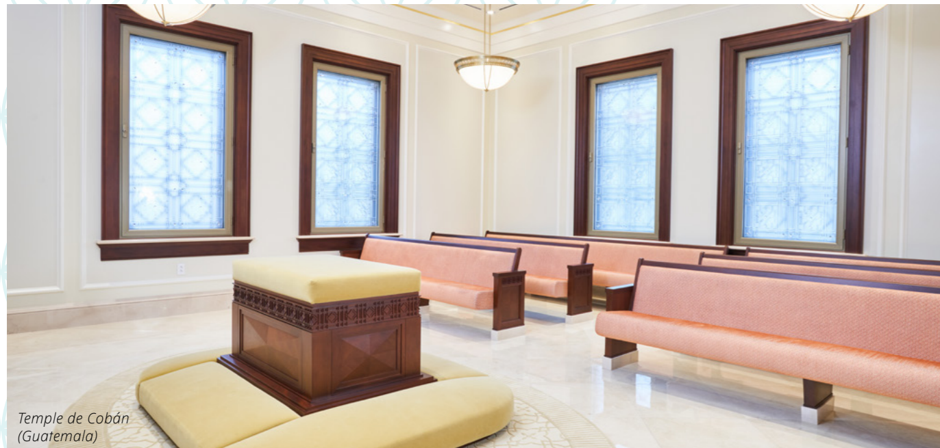
Temple de Cobán (Guatemala)

▲ Les fontes baptismaux sont l'endroit où l'on est baptisé pour les personnes décédées. Les douze bœufs qui entourent les fontes baptismaux représentent les douze tribus d'Israël.