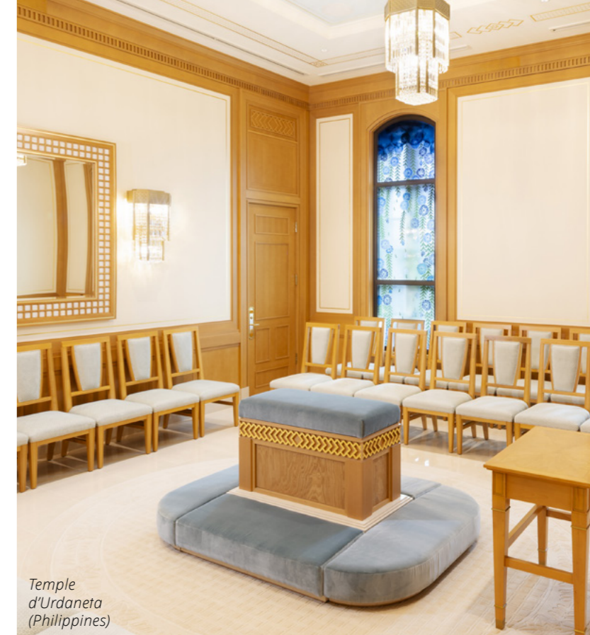
Temple d'Urdaneta (Philippines)

▲ La salle de scellement est l'endroit où les couples et les familles sont scellés pour le temps et l'éternité.