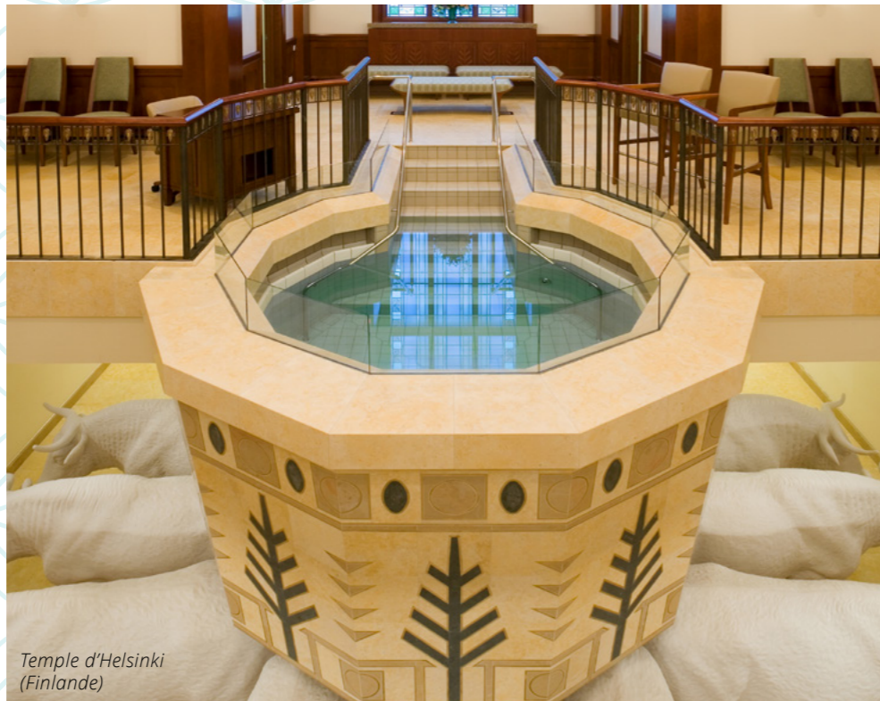
Temple d'Helsinki (Finlande)

À l'intérieur du temple, nous en apprenons davantage sur le plan du salut et nous faisons des alliances avec notre Père céleste. Il y a de nombreuses salles magnifiques où nous pouvons ressentir la paix du Saint-Esprit.