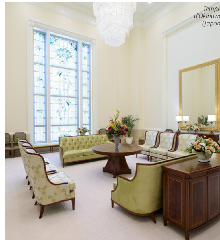
Temple d'Okinawa (Japon)

La salle céleste nous aide à imaginer ce que cela sera de vivre à nouveau avec notre Père céleste. C'est un endroit où l'on peut prier, méditer et lire les Écritures.