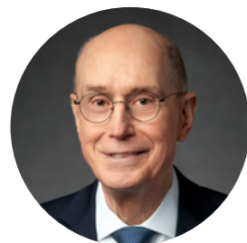
Na Rais Henry B. Eyring Mshauri wa Pili katika Urais wa Kwanza