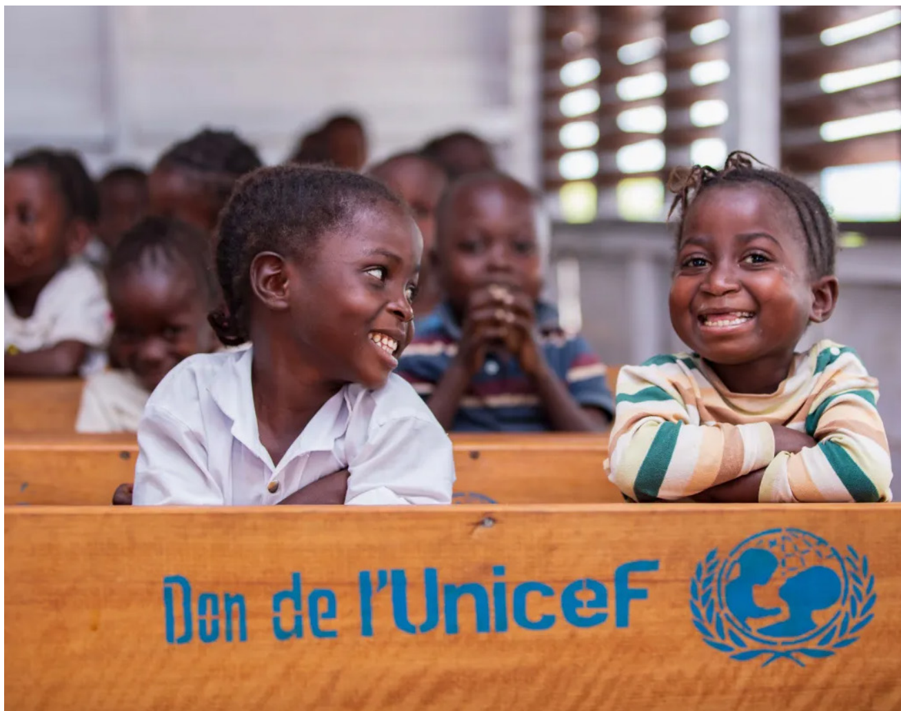
Acima: duas crianças pequenas no Sudão do Sul frequentam alegremente sua nova escola.

a poliomielite, galinhas para ajudar famílias com dificuldades, kits de higiene feminina e muito mais. Pessoas de todo o mundo contribuíram, resultando num total de milhões de doações.