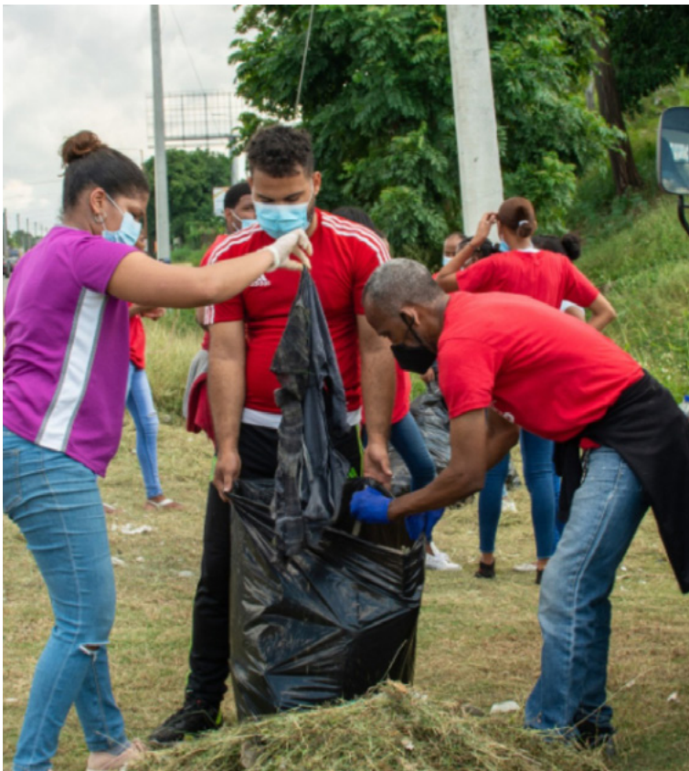
Foto acima: os residentes do Caribe se apoiam mutuamente após o impacto do furacão Fiona.