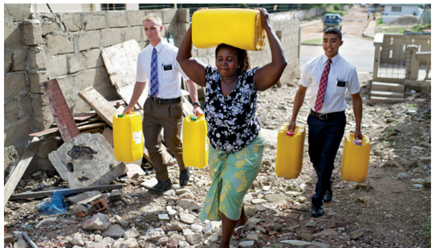
Acima: dois missionários servem ao povo de Gana, na África Ocidental.