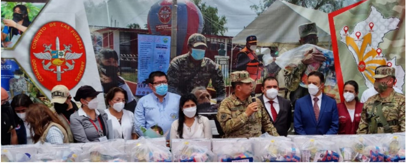
Acima: um grupo de oficiais reúne doações para o Hospital Geral de Barrio Obrero [General Hospital of the Barrio Obrero], em Assunção, no Paraguai.