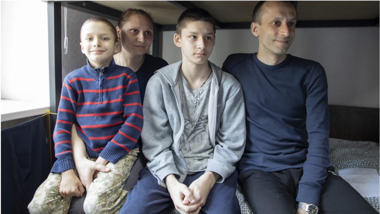
Acima: uma família ucraniana que encontrou abrigo em outro país europeu.

“A Igreja de Jesus Cristo dos Santos dos Últimos Dias é uma das parceiras mais confiáveis e duradouras dos EUA para ACNUR. Juntos, continuamos a restaurar a esperança, a segurança e a dignidade para as mais de 100 milhões de pessoas que foram expulsas à força de suas casas devido à perseguição, conflitos ou violência. ”