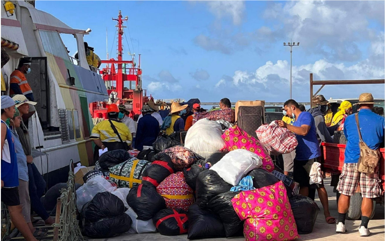
Acima: as congregações da área reuniram e doaram os itens necessários para ajudar o povo de Tonga.

“O trabalho humanitário da Igreja é esse presente. É o produto das ofertas consagradas coletivas dos santos, uma manifestação de nosso amor a Deus e a Seus filhos.”