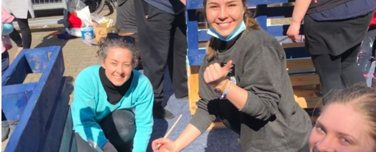
Acima: um grupo de missionários de serviço pinta móveis no centro de refugiados desabrigados Caritas, em Friedrichsdorf, na Alemanha.