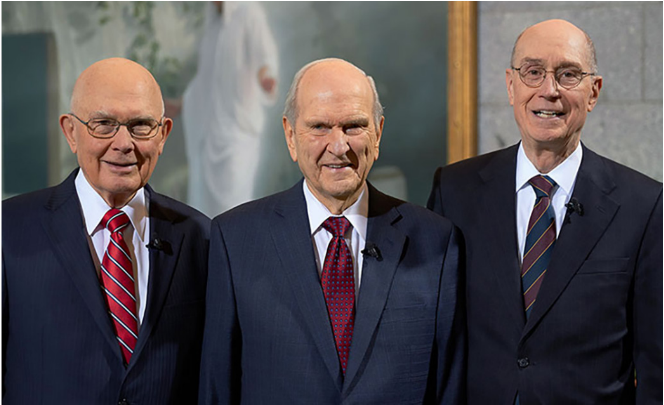
Acima: o presidente Russell M. Nelson com seus dois conselheiros, Dallin H. Oaks e Henry B. Eyring.