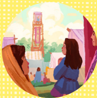
聖靈、神、遵守誡命、聖靈

便雅憫王邀請人民承受基督的名。也就是說，他們立下聖約或承諾，要跟從神並遵守祂的誡命。