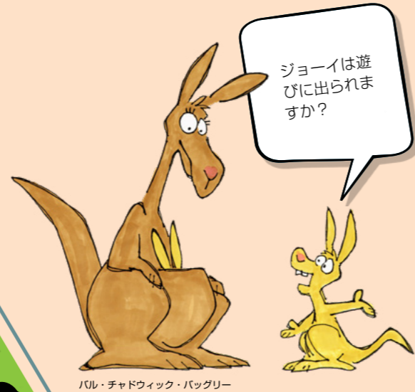
パウル・チャドウィック・バググリー

すべての羊が囲いに入るよう、羊を並べます。これを行うには、29 ページのパズルのピースを切り取って（次のページの記事を読んだ後）配置するか、そのページの羊の絵を描きます。