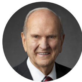
Par Russell M. Nelson, président de l'Église