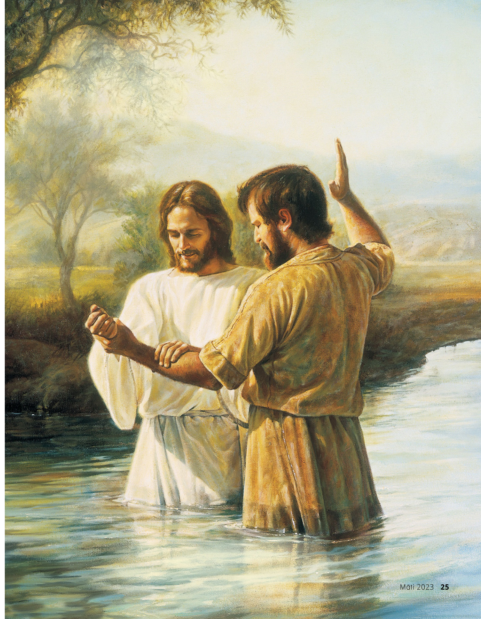
HŌHOA PENINĀ GREG K. OLSEN

E nehenehe 'oe e tai'o i teie 'ā'amu i roto i te Mataio 3.