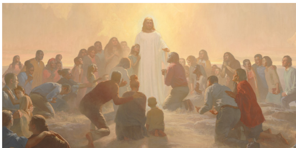
KOM TIL JESUS (COME UNTO JESUS), AF MICHAEL MALM

Gud lever. Jesus er Kristus. Hans kirke er blevet genoprettet for at velsigne alle Guds børn. ●