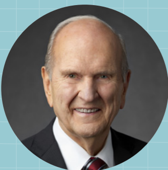
Præsident Russell M. Nelson