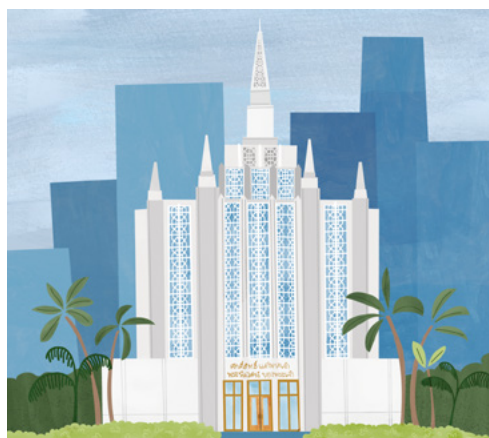
Temple de Bangkok (Thaïlande)