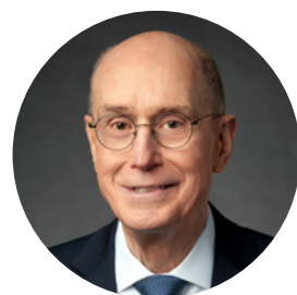
Prezident Henry B. Eyring Druhý radca v Prvom predsedníctve