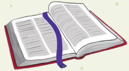
Tala faatusipaia: Ina ua papatisoia Iesu