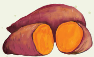
Fualaau faisua: Ufi