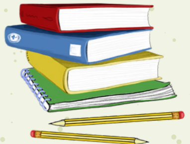
Mataupu i le aoga: FaaPeretania