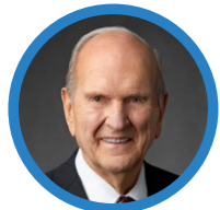
ㄱ. 러셀 엠 넬슨 회장

“부모 여러분, 자녀를 키우는 여러분의 노고에 감사드립니다. 그리고 자녀 여러분, 부모님이 성장할 수 있게 키워 주는 여러분의 수고에 감사드립니다.”