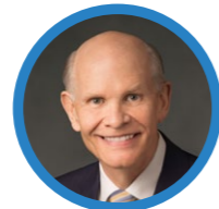
ㄹ. 데일 지 렌랜드 장로