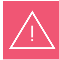
Planificación para emergencias

Las siguientes pautas y actividades pueden ayudarlo a estar más preparado.