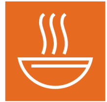
Almacenamiento y producción de alimentos en el hogar